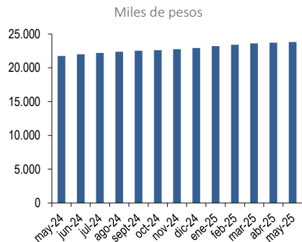
Gráfico elaborado por Feller Rate en base a información provista voluntariamente por la Administradora.