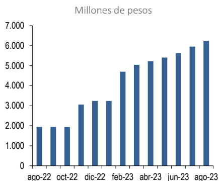
Gráfico elaborado por Feller Rate en base a información provista voluntariamente por la Administradora.